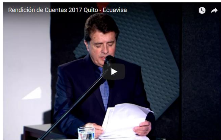
Televisora Nacional Compañía Anónima Telenacional C.A. – ECUAVISA Canal 8 RENDICIÓN DE CUENTAS 2017

En cumplimiento de lo dispuesto en el artículo 90 de la Ley Orgánica de Participación Ciudadana, Televisora Nacional Compañía Anónima Telenacional C.A., invita a la presentación del Informe de Rendición de Cuentas correspondiente al año 2017, el mismo que se desarrollará este día martes 27 de febrero de 2018 a las 15h00, en las instalaciones ubicadas en las calles Bosmediano 447 y José Carbo.